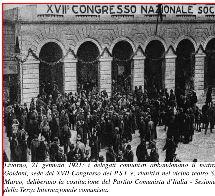
Livorno, 21 gennaio 1921: i delegati comunisti abbandonano il teatro Goldoni, sede del XVII Congresso del P.S.I. e, riunitisi nel vicino teatro S. Marco, deliberano la costituzione del Partito Comunista d'Italia - Sezione della Terza Internazionale comunista.

Le gloriose lotte contro il fascismo, nella guerra civile di Spagna, durante la Resistenza, fecero acquisire al partito forza e solidi legami con le masse, fornendo per contro alle masse sfruttate ed oppresse una guida ideologica, politica ed organizzativa nella lotta per la nuova società.